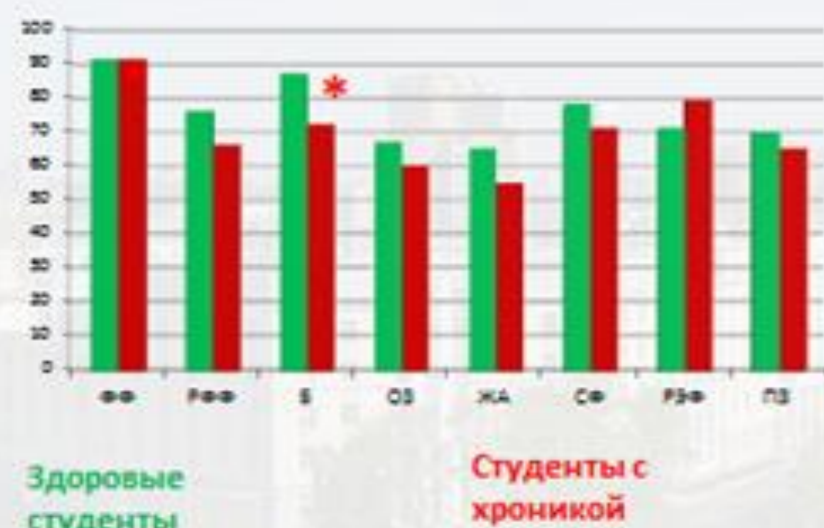
Рис 3. Показатели качества жизни были сниженными у студентов, обучающихся профессии слесаря, имеющих хронические заболеваниями, по большинству параметров показателю физического КЖ

Учебно-производственная нагрузка в подгруппе обучающихся с хронической патологией, сопровождается более высоким числом негативных проявлений и жалоб. Это требует качественного медицинского обслуживания студентов колледжей, которое значительно хуже, чем в школах.