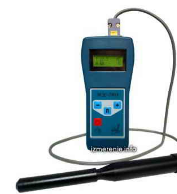
Прибор контроля параметров воздушной среды «Метеометр МЭС-200А»