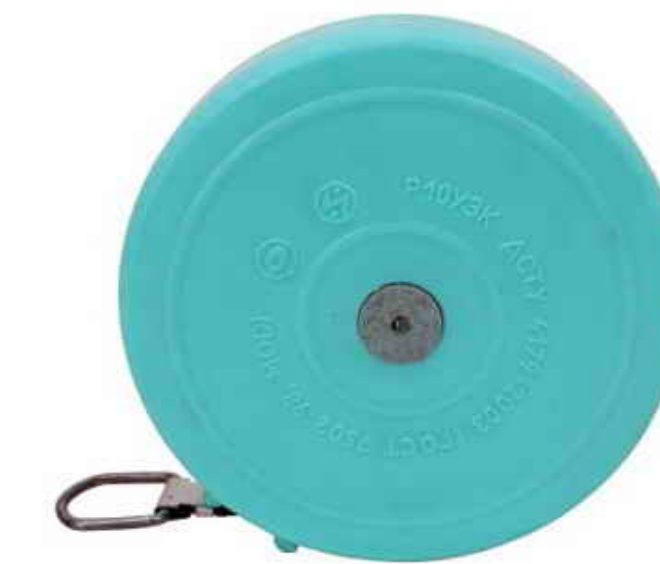
Рулетка измерительная металлическая Р10УЗК

!!! Допускается применение других средств измерений и вспомогательных устройств с аналогичными или лучшими метрологическими и техническими характеристиками !!!