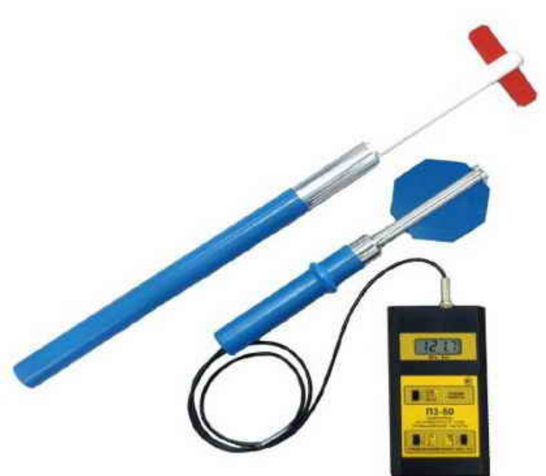
Измеритель напряженности поля промышленной частоты ПЗ-50