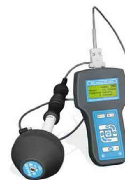
Измеритель параметров электрического и магнитного полей трехкомпонентный ВЕ-метр-АТ-003