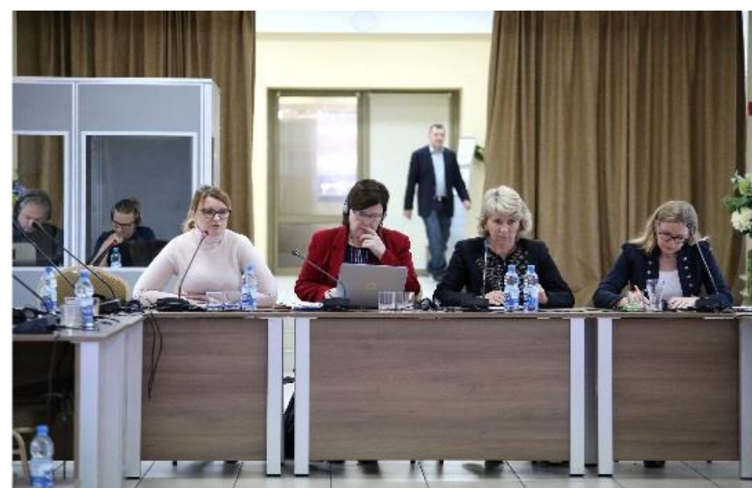
Технические барьеры доступа на рынок Китая для экспортеров молочных продуктов